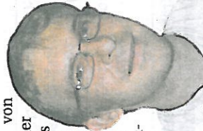
Die Mehrheit der Gäste