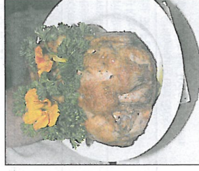
Für Kapaun ist der «Blasenberg» schweizweit bekannt.

Gartenwirtschaft mit «Plättli» und Aussicht